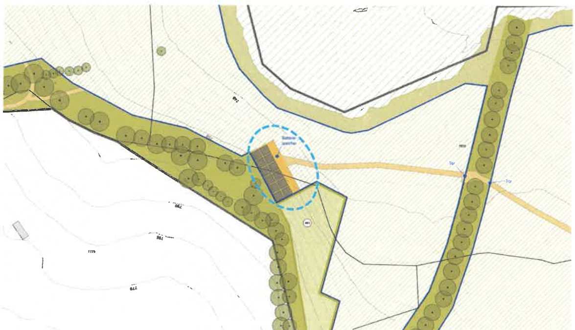
Abbildung 3: Auszug Bebauungsplan – mögliche Situierung von Batteriespeichern