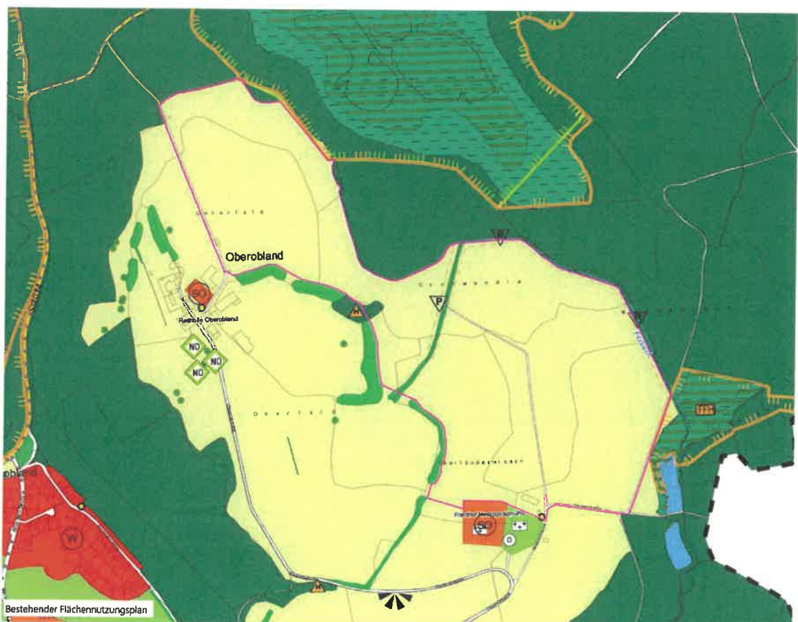
Abbildung 1: Auszug aktueller Flächennutzungsplan Markt Peiting mit Umgriff der 9. Änderung

Im aktuell rechtskräftigen Flächennutzungsplan des Marktes Peiting mit dem Ortsteil Herzogsägmühle (Stand 23.07.2019) ist der Änderungsbereich überwiegend als landwirtschaftliche Nutzfläche dargestellt. Im Westen des Geltungsbereiches befinden sich zu erhaltende Gehölzstrukturen sowie der sogenannte „Hutewald“. Der in der Mitte des Plangebiets verlaufende Graben ist als Grünfläche („Filzbach“) dargestellt. Im Geltungsbereich