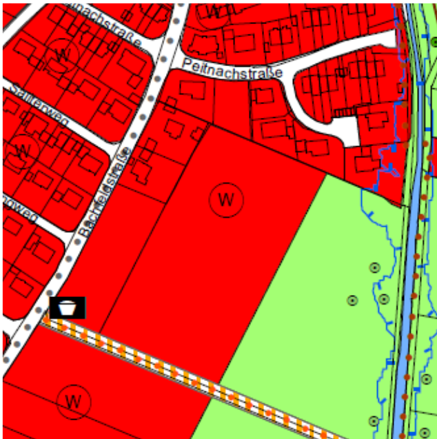
Abbildung 1: Ausschnitt aus dem Flächennutzungsplan