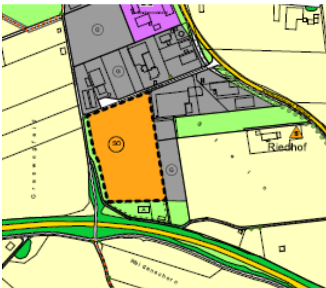
geplante 1. Änderung

Dieser wird im Rahmen der 1. Änderung im Parallelverfahren gem. § 8 Abs. 3 BauGB geändert.