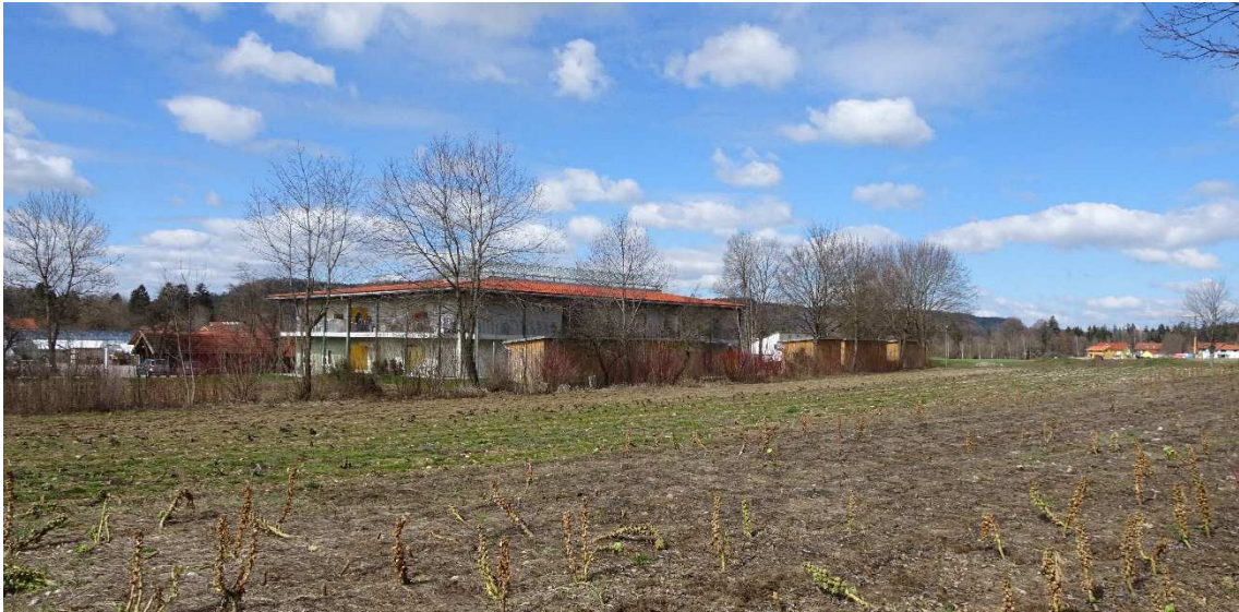
Abbildung 2: Blick in Richtung Nordwesten auf die Feldgehölzhecke, den Gemüseanbau sowie das bestehende Gebäude (eigene Aufnahme 28.03.2019)