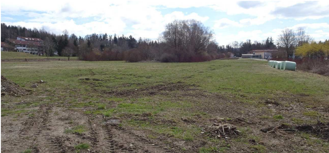
Abbildung 3: Blick in Richtung Süden auf das Intensivgrünland (eigene Aufnahme 28.03.2019)