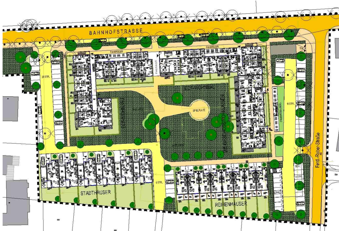
Planausschnitt VEP-Plan EG